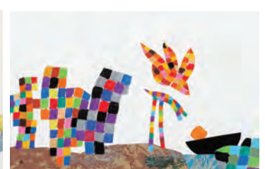
「ベツエッティーノ」1975 年 Pezzettino © 1975 by Leo Lionni, renewed 2004 by Nora Lionni and Louis Mannie Lionni/Pantheon