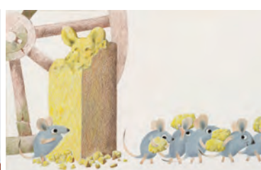
「おんがくねずみジュラルディン」1979 年 Geraldine, the Music-Mouse © 1979 by Leo Lionni/Pantheon