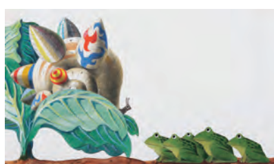
「せかいいちのおきなうち」1968 年 The Biggest House in the World © 1968 by Leo Lionni, renewed 1996/Pantheon