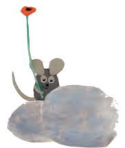
「フレデリック」1967 年 Frederick © 1967, renewed 1995 by Leo Lionni/Pantheon

「2018 イタリア・ボローニャ国際絵本原画展 / 西宮市大谷記念美術館 / 8 月 11 日 (土) ~ 9 月 24 日 (月祝)